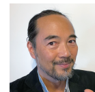
担当 平野景由 6/6,13,20,27,7/4,11,25,8/1 (全16コマ)