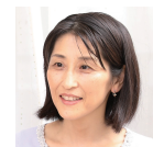
担当 村田容子 4/6,13,20(全6コマ)