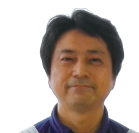
担当 蔵本孝治 6/9,23,7/7,21(全8コマ)