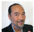
担当 平野景由 4/4,11,18,25,5/9,16,23,30 (全16コマ)