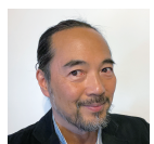
担当 平野景由 6/14,21,28,7/5,12,19,26,8/2 (全16コマ)