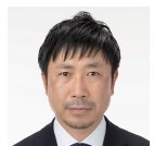
担当 森哲也/井出哲郎 6/29,7/6,13,20,27 (全13コマ)