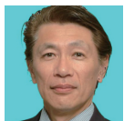
担当 市橋裕一 4/12,19,26,5/10,17(全9コマ)